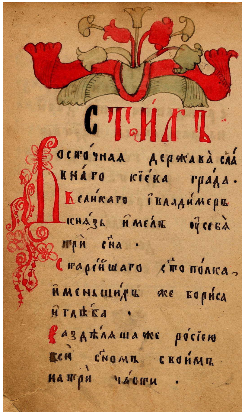
Сборник духовных стихов. XX в. Заставка в красках, инициал (НБ СГУ, Верхне-печорское р., 7).