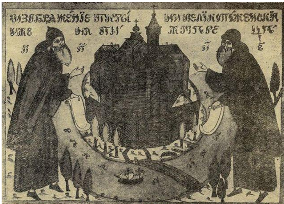
Вид Великопоженского общежительства. Рисунок посл. четв. XIX в. (Государственный литературный музей)

В приводимой ниже таблице мы указали наиболее ценные находки, ставшие уже, по большей части, предметом научного исследования. Ими могут по праву гордиться жители этих сел и деревень. В тех случаях, когда в каком-то населенном пункте были найдены одна-две рукописи, мы приводим о них сведения в не зависимости от степени их научной значимости.