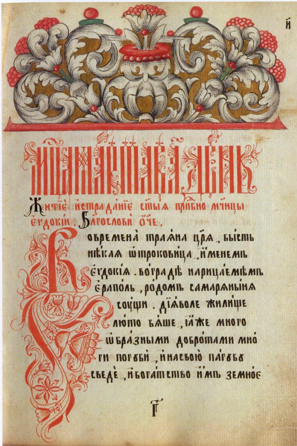
Сборник служб и сказаний. XVIII в. (кон.) - XIX в. (нач.). Поморский полуустав. Заставка поморского стиля. Рисованный инициал (ОРК НБ СыктГУ, СП.р.-49).